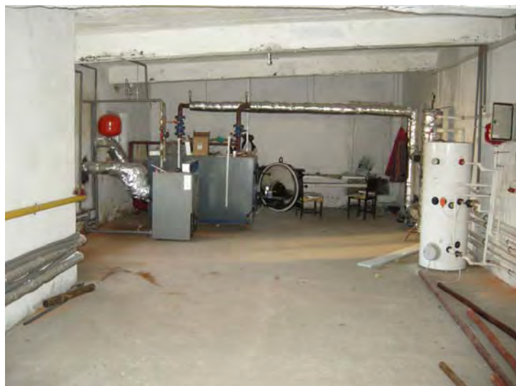
Cazan termic biogaz în centrala termică