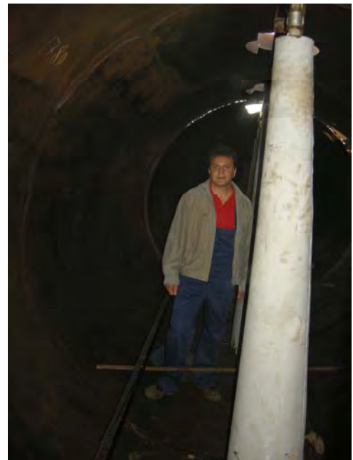
Vedere interior fermentator