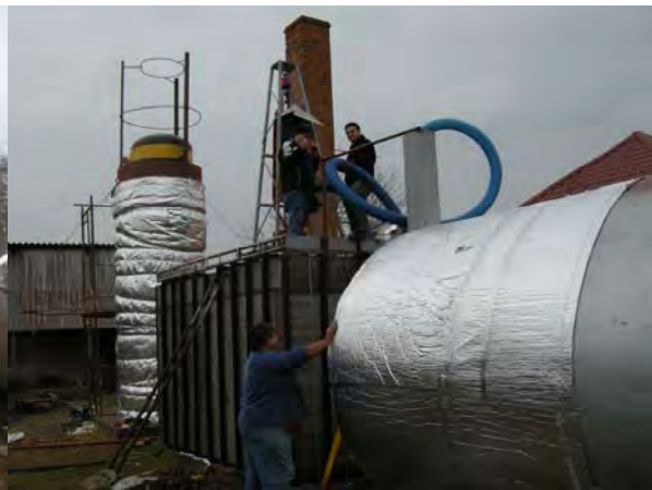
Montaj pompă de alimentare pe bazin amestec