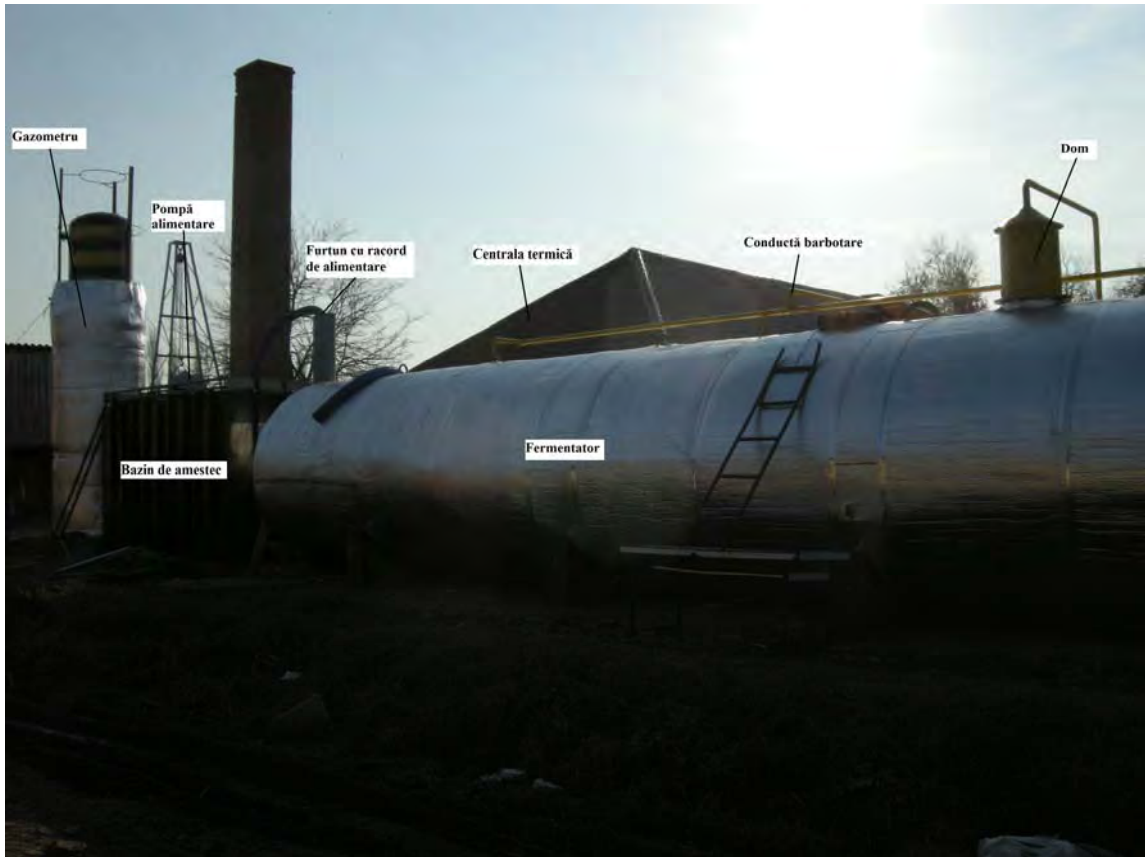
Vedere de ansamblu