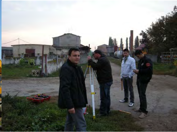
Măsurat nivel pt. scurgere digestat