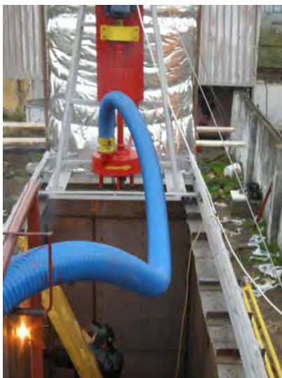
Detaliu pompă și bazin amestec