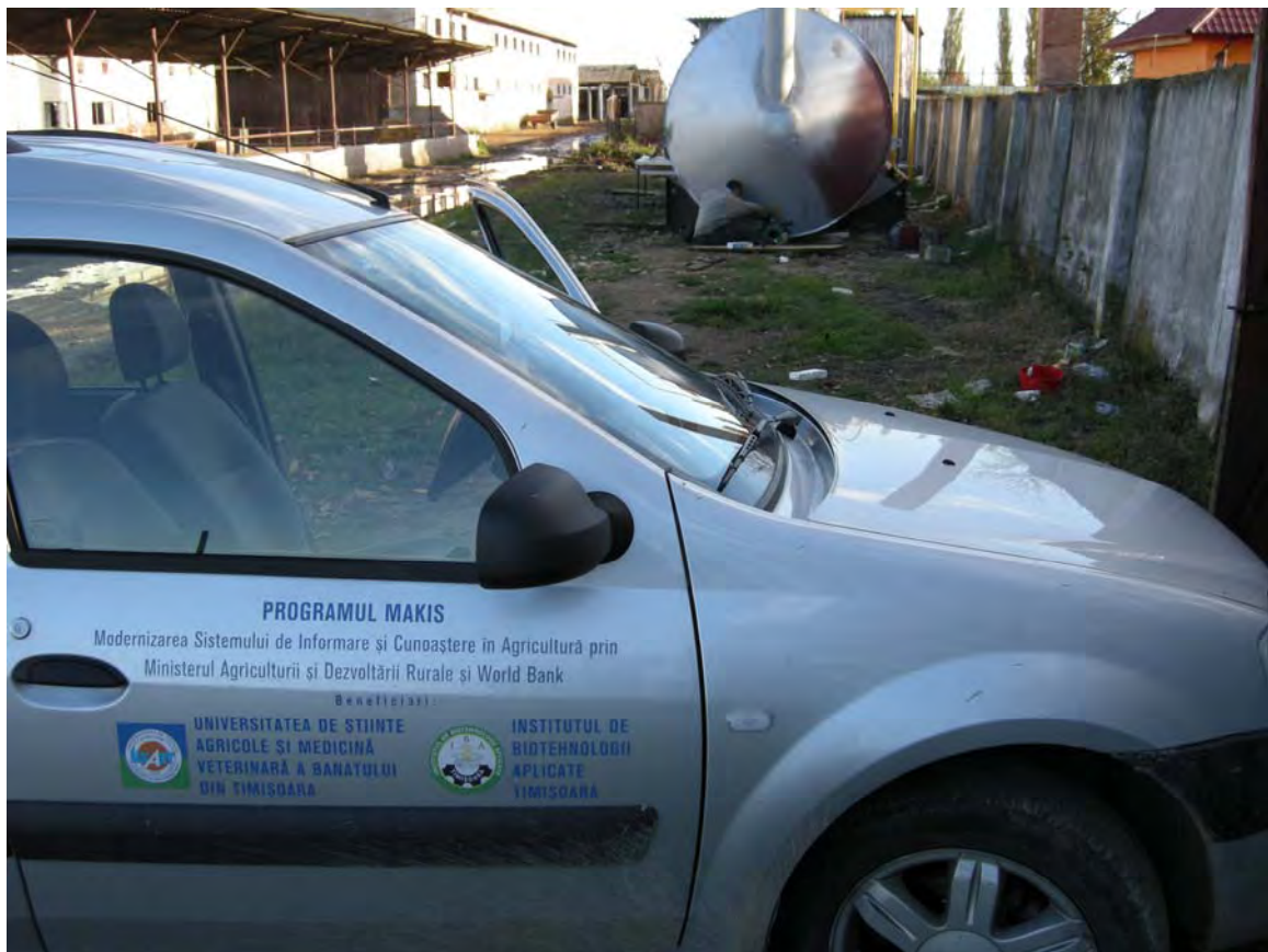
Programul MAKIS – Modernizarea Sistemului de Informare și Cunoaștere în Agricultură